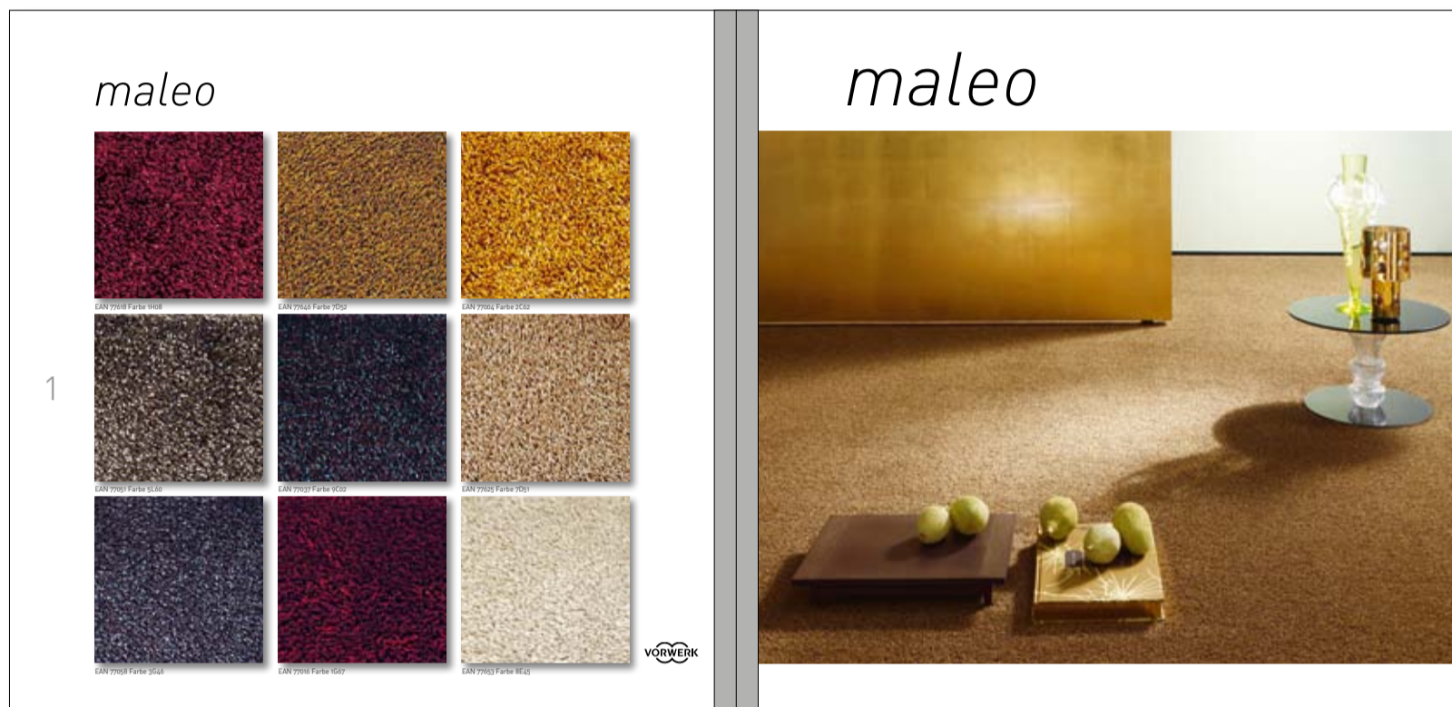
Maleo: eine der vielfältigen Teppichqualitäten aus dem Bereich „Styling“.

Die neue Vorwerk Projection bietet Teppichboden und Teppichfliesen für alle wichtigen Einsatzgebiete im Objektbereich.