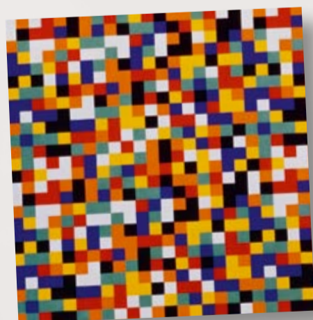
19413 ART 194D G.Richter Rapport 133 x 92,5 cm

Gerhard Richter, deutscher Maler, über seine Kunst: „Ich beginne mit einem ganz weichen Grund – ein illusionistischer Bildraum, mit Rot, Gelb, Blau oder Grün. Erst Pinsel und Spachtel verändern die Leinwand in vielschichtige Bildräume.“