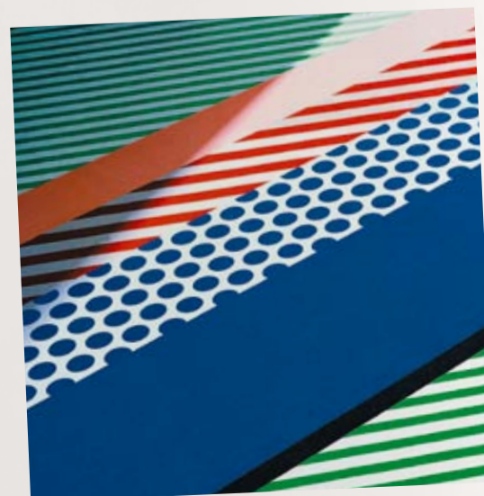
44014 ART 440E R.Lichtenstein Rapport 600 x 92,5 cm

Roy Lichtenstein, peintre, fait partie des représentants les plus importants du pop art. Il est entré dans l'histoire de l'art parce qu'avec « un coup de pinceau gelé » et un point de trame précis, mais dépassé, il a fait entrer Mickey Mouse et Donald Duck dans les galeries du monde.